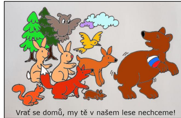
Vrať se domů, my tě v našem lese nechceme!

Return home, we don't want you in our forest. Повертайся додому, ми не хочемо, щоб ти був у нашому лісі.