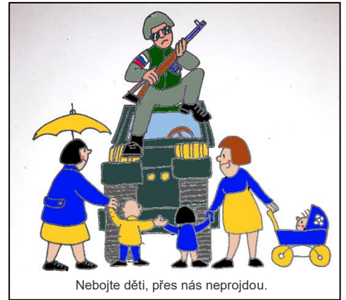
Nebojte děti, přes nás neprojdou.

We managed to decipher that their catastrophe was started on February 24, 2022 by a Putin. Нам вдалося розшифрувати, що їхню катастрофу розпочав 24 лютого 2022 року Путін.