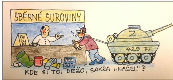
Where the hell did you get it, Dežo? Де ти це взяв, Дежо?