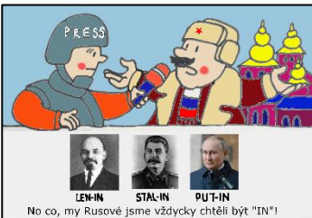
No co, my Rusové jsme vždycky chtěli být "IN"!

Damn, they're defending themselves! Блін, вони захищаються!