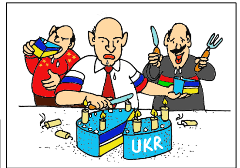
Putinův dezert. Putin's dessert. Путінський десерт.

Don't worry kids, they won't go through us. Не хвилюйтеся, діти, вони через нас не пройдуть.