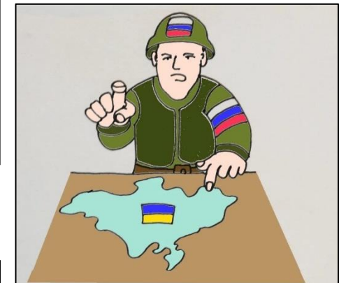
Mírové rozhovory Rusko - Ukrajina

Ukraine Peace talks. Мирні переговори між Росією та Україною.