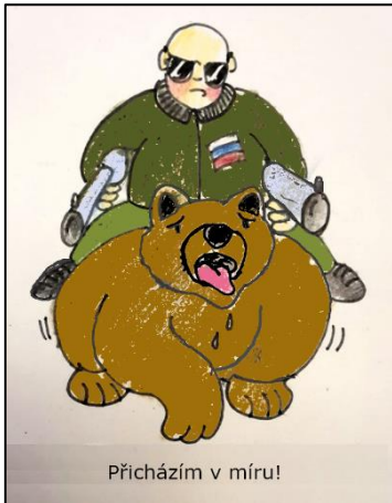
Přicházím v míru!

Evžen Novák – noegraphic – fb.com/evzen.novak.9693 – od 24.2.2022