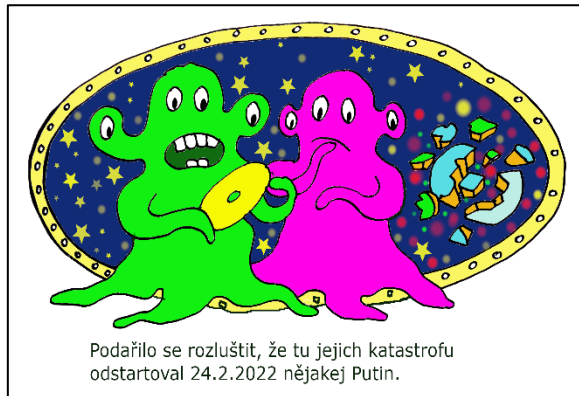
Podařilo se rozluštit, že tu jejich katastrofu odstartoval 24.2.2022 nějaký Putin.

Well, we Russians have always been "IN"! Ну, ми, росіяни, завжди були «IN»!